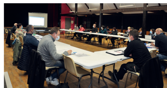
Les premiers conseils se sont tenus à la salle des fêtes.