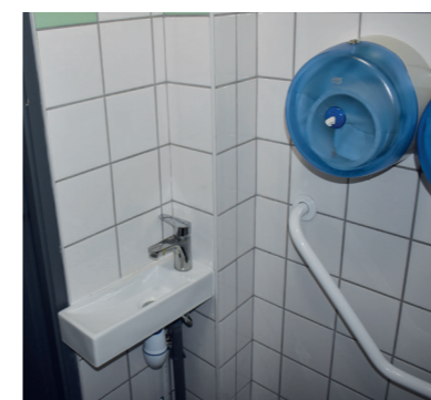
Dans la salle des fêtes, réfection du parquet de la mezzanine et mise aux normes d'accessibilité des sanitaires.