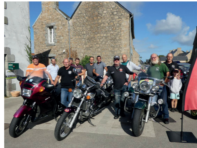
30 août / Le MCCB compte 46 adhérents.