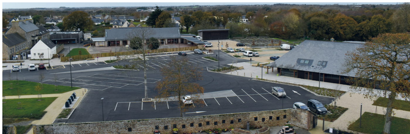
La vaste esplanade devient le cœur du nouveau bourg de Cavan.