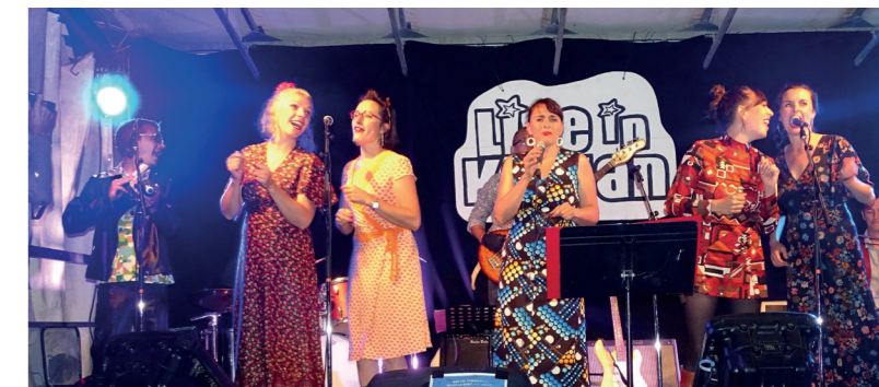
13 juillet / Ti ar Vro organise la Fête de l'Ère Nouvelle en partenariat avec la commune, ici les Poules à Facettes.