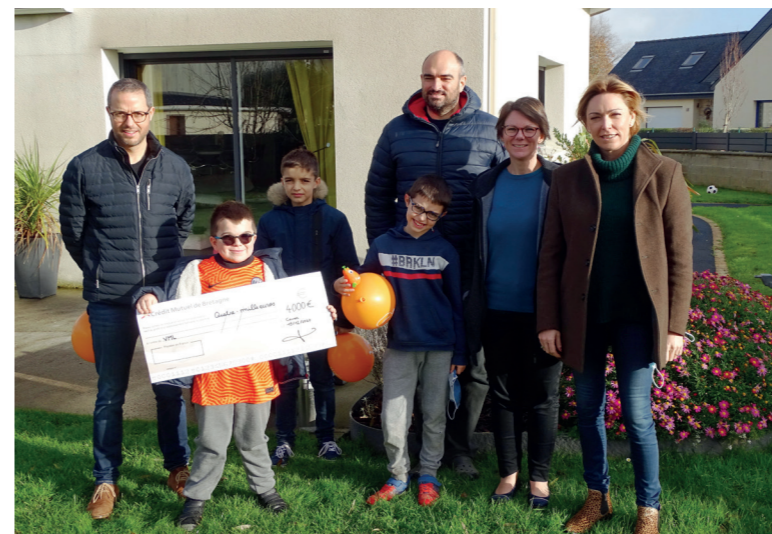
19 décembre / L'association Dans les pas de Clément remet 4 000 € à « Vaincre les Maladies Lysosomales ».