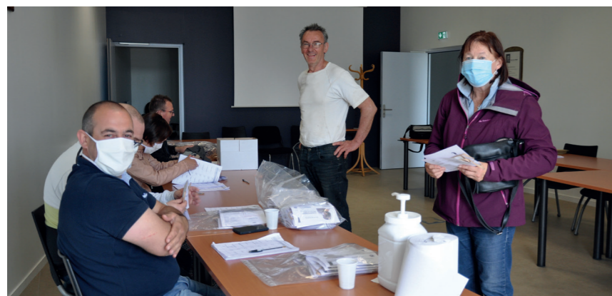
Deux distributions de masques ont été organisées en mai. En novembre, chaque élève de l'école a également reçu 4 masques par la mairie.