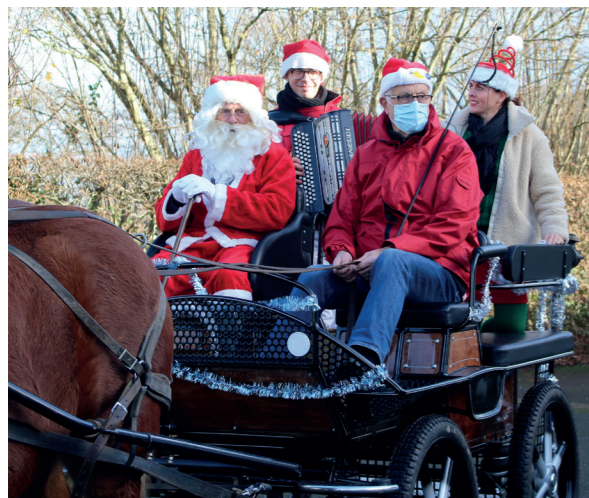
Le Père Noël s'est déplacé en calèche et en musique pour livrer ses présents aux adhérents du Club de l'Amitié.