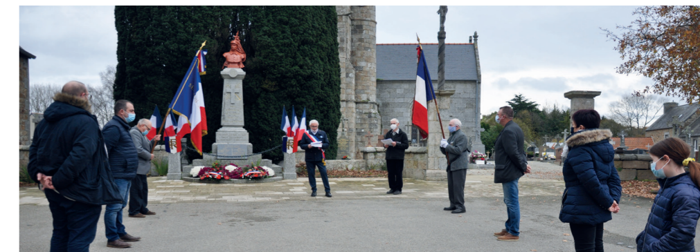
C'est en comité très restreint que s'est déroulée la cérémonie du 11 novembre cette année... ce qui n'a pas empêché l'émotion d'être présente.