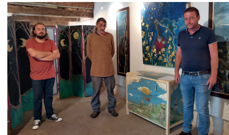
26 août / L'expo de la Coopérative des Chimères, par Cédric Bonjour, David Le Hegaret et Christian Goinclin.