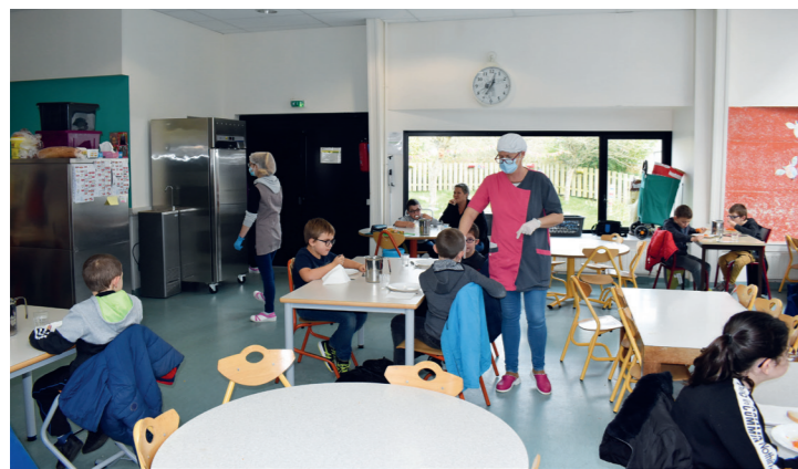
Les élèves mangent avec leurs camarades de classe, afin de ne pas mélanger les groupes.

Concrètement, dans la salle de restauration, les tables du premier service (maternelles) ont été disposées entre les tables du second service (élémentaires). Ainsi, les enfants sont davantage distancés les uns des autres, sans pour autant avoir besoin de nouveaux espaces.