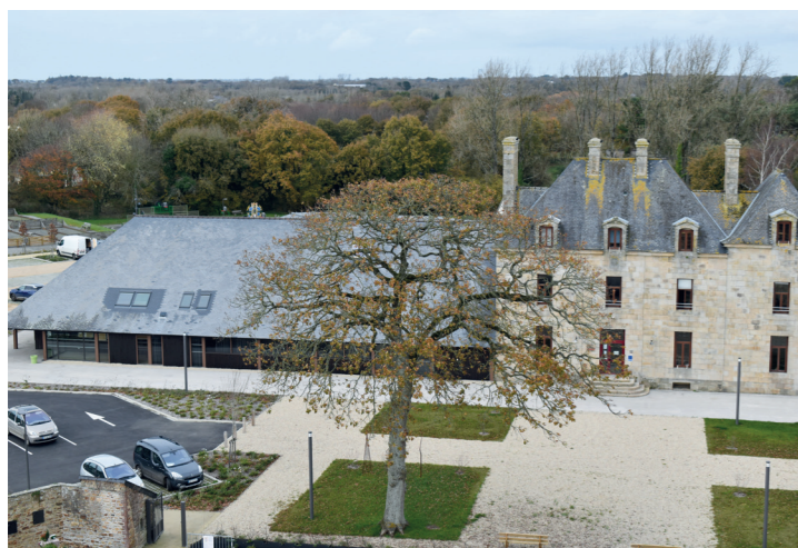
La façade de l'ancien presbytère, aujourd'hui Ti ar Vro, est mise en valeur avec l'aménagement d'un jardin.