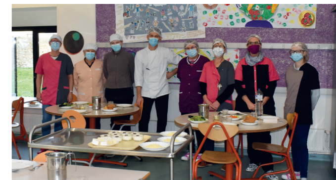
Pour le bon déroulement de la pause méridienne, 8 agents municipaux assurent la préparation, le service, la surveillance et le rangement de la cantine.