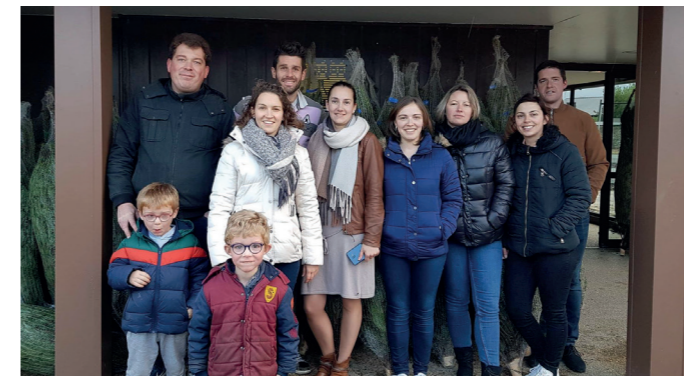
7 décembre / 55 sapins livrés pour l'Amicale Laïque.