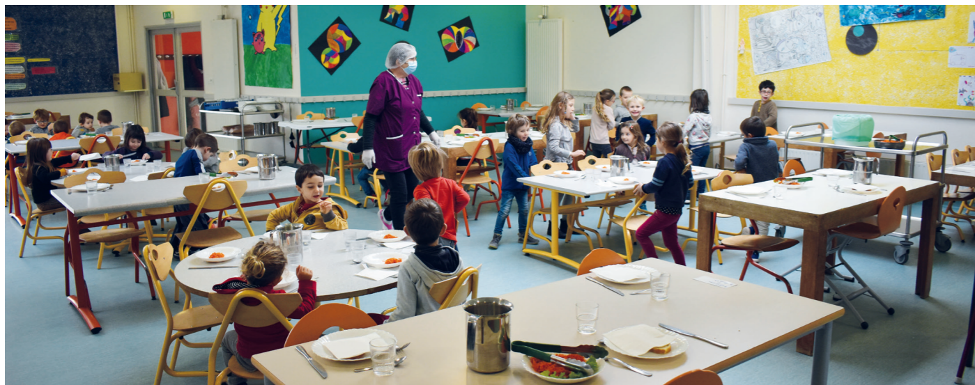
Les tables des maternelles ont été disposées entre les tables des élémentaires : les élèves sont ainsi plus distancés les uns des autres.

Depuis le début de la crise sanitaire, la cantine a mis en place, pour la troisième fois, une nouvelle organisation dès la rentrée du 2 novembre. Le port du masque, le non-brassage des groupes et la distanciation d'un mètre ont considérablement modifié le travail des agents communaux.